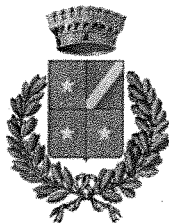
CAPRIANO DEL COLLE