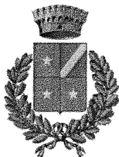
CAPRIANO DEL COLLE